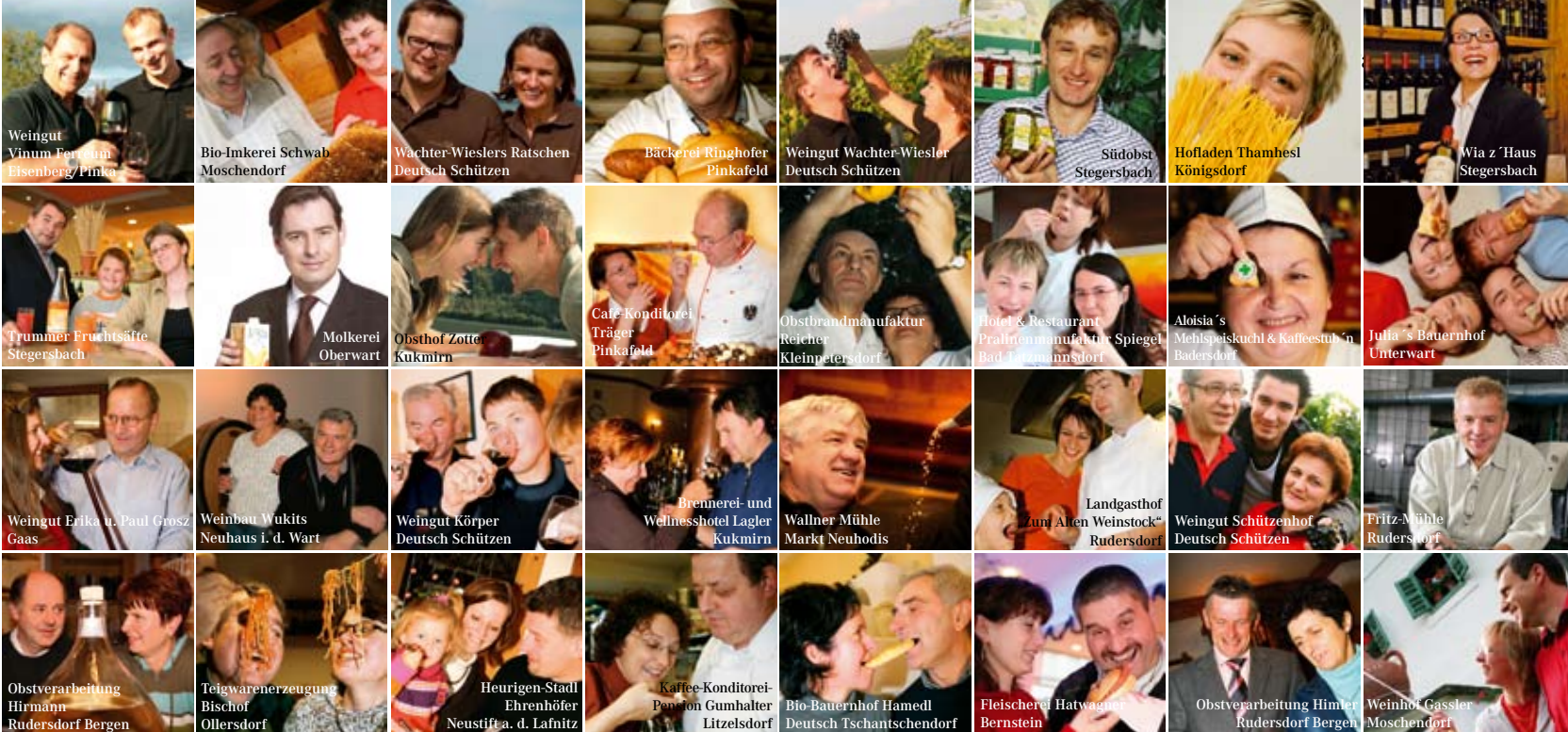
Weingut Vinum Ferratum Eisenberg/Pinka