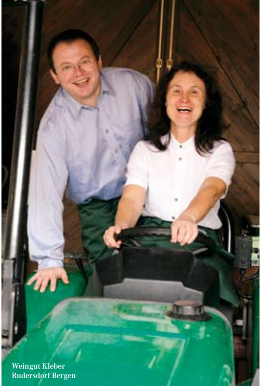
Weingut Kleber Rudersdorf Bergen