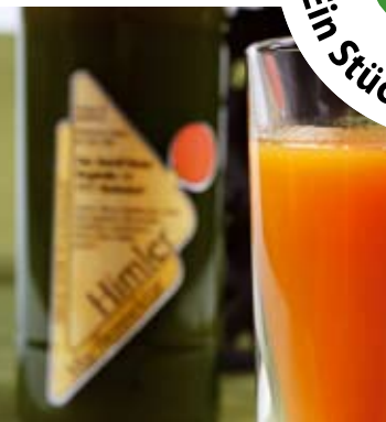
Verein „rund um 's moor“ Rohr